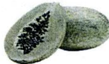
mù guā 木瓜 papaya