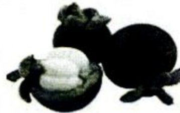
shānzhú 山竹 mangosteen