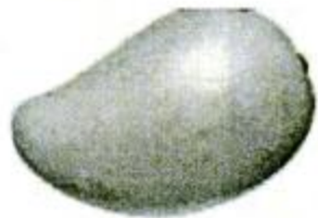
mángguǒ 芒果 mango