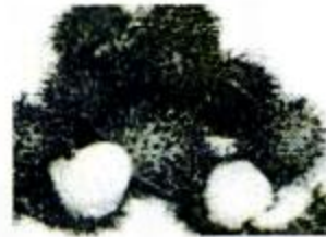
hóng máo dān 红毛丹 rambutans