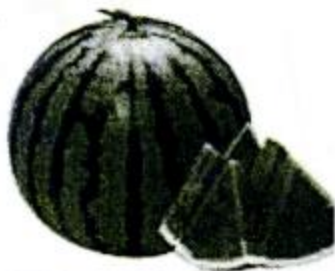
xī guā 西瓜 watermelon