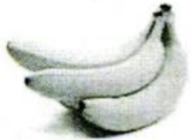
xiāngjiāo 香蕉 banana