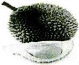
liúlián 榴梿 durian