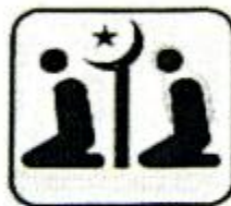
qídǎo shì 祈祷室 prayer room