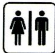
cèsuǒ 厕所 washroom