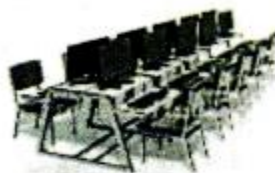
diànnǎo shì 电脑室 computer room