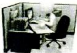
bàngōng shì 办公室 office