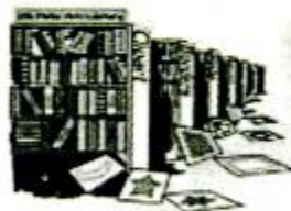
túshū guǎn 图书馆 library