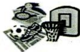
tǐyù guǎn 体育馆 sport complex