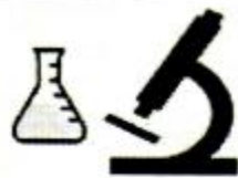
shíyàn shì 实验室 laboratory