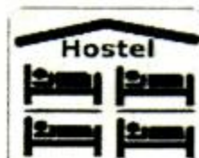
sùshè 宿舍 hostel